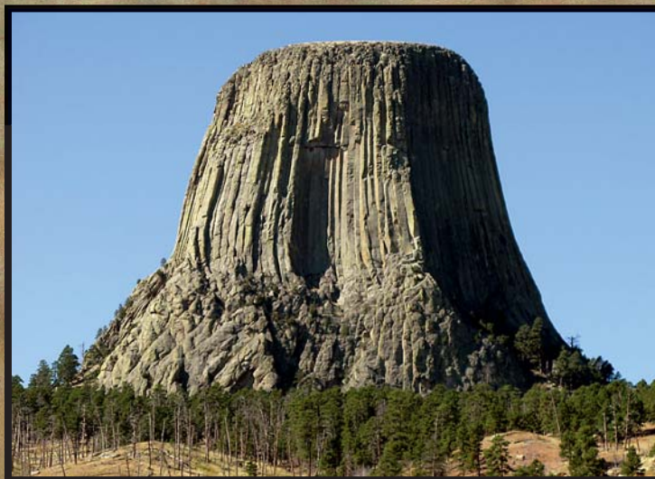
Штаб-квартира организаторов охоты Trophy Ridge Outfitters расположена в нескольких шагах от национального природного памятника, скалы Башня Дьявола, самой впечатляющей достопримечательности северо-восточного Вайоминга

Племя индейцев лакота-сиу хранит историю о семи маленьких девочках, которые заблудились вдали от своего посёлка и их начали преследовать огромные медведи. Перепуганные дети забрались на вершину скалы и молились Великому Духу о помощи. Великий Дух услышал их мольбу и сделал так, что скала с девочками наверху начала расти. Разъярённые медведи пытались забраться на скалу, процарапав на ней глубокие следы своими когтями со всех сторон, но она была слишком крута, и им пришлось отступить. Когда скала поднялась в полный рост и вместе с девочками достигла неба, то они превратились в созвездие Плеяд.