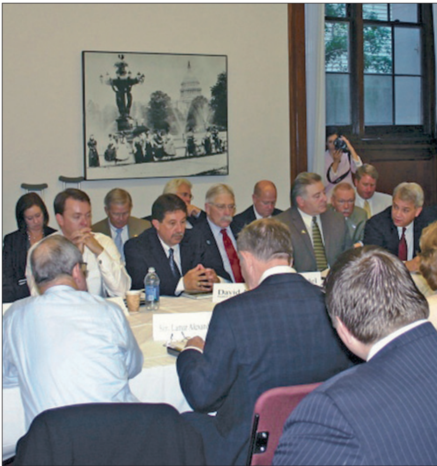
Даллас Сафари клуб

Итак, после вступления и представлений артистов, по традиции, единственный конник должен был пройти шагом по арене по кругу, держа подвесь американский флаг. И как раз во время этого гала-представления в Лондоне, когда конник шествовал мимо королевы Виктории, Её Величество приподнялась и склонила голову перед символом американской независимости – отважный и памятный жест,