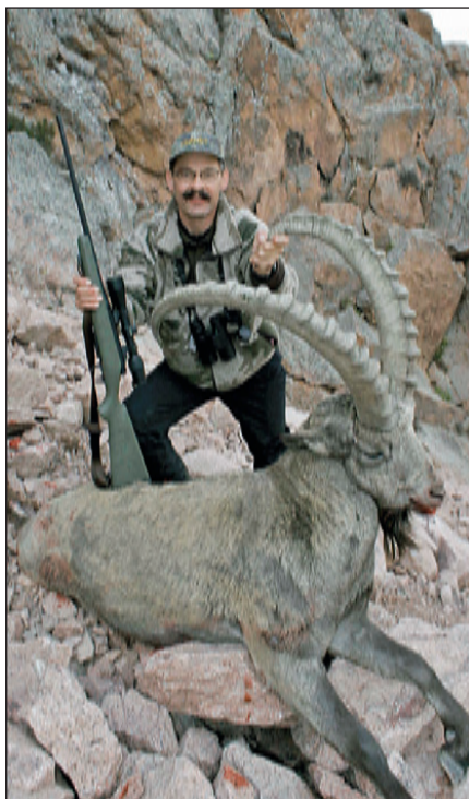
Сверху: Охота на Тянь-Шане не для слабонервных; среднеазиатский козерог является самым крупным в мире

Е сли вы любите горы – устремлённые ввысь пики со снежными шапками, обширные пространства тундры, ледниковые озёра, быстрые и бурные реки и диких овец и коз – вы любите и Кыргызстан. Около 94% территории страны находится на высоте около 1000 м или выше над уровнем моря. Гораздо выше, на самом деле: средняя высота составляет чуть более 2500 м. Самое большое возвышение, Дженгиш Чокусу или пик Победы (названный так в честь победы СССР над Германией во Второй мировой войне) достигает головокругительных 7439 м. Около 3% территории страны покрыто вечным снегом и ледниками, хотя она расположена примерно на той же широте, что и Вашингтон, округ Колумбия.