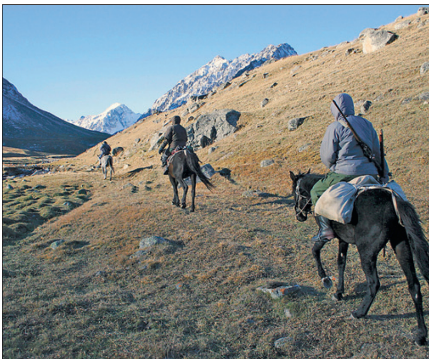
Маленькие горные лошадки используются при охоте на козерога

Поскольку через территорию Кыргызстана проходят маршруты Великого шёлкового пути, страна подвергалась нашествиям в течение многих столетий, но никому так и не удалось завоевать её полностью. В этой защищённой горами крепости местным племенам и скотоводам удалось сохранить свою автономию и этническую самобытность. Здесь, конечно, прошли армии Чингисхана. Царская Россия аннексировала эти земли в 1876 г., но неуступчивые местные жители восстали в 1916 г. Советы опять покорили их и сделали в 1936 г. республику,