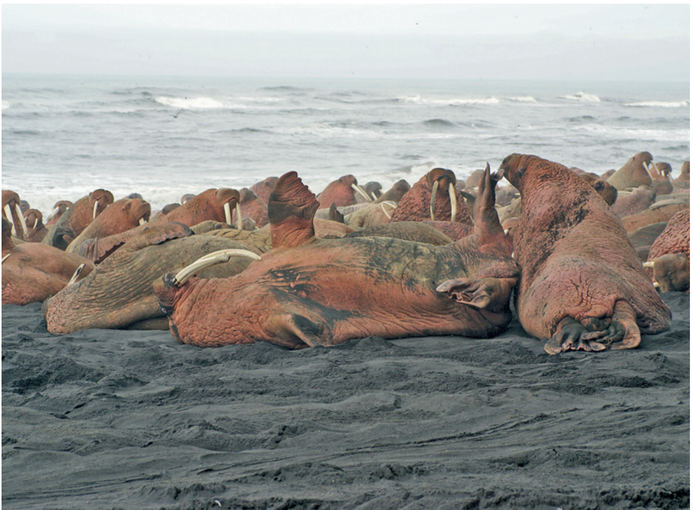
Охотникам предоставили возможность насладиться великолепным зрелищем огромной и довольно шумной колонии моржей недалеко от приюта. Вполне возможно, подойти и поближе к этим удивительным животным

Вечером Батч поинтересовался у нас, готовы ли мы для комбинированного захода на моржа и куропаток на следующее утро. Как выяснилось, в районе приюта Уайлдмэн Лэйк Лодж водится большая колония моржей, которые по большей части нежатся на гигантском выступе берега, близ крутых скал, населённых тысячами весьма крикливых чаек. Это было волнующее предложение – вот так вот запросто подойти к этим огромным зверюгам, которые хоть и выглядят обманчиво неуклюжими, но могут броситься всем скопом к океану со скоростью, которая превосходит всякое воображение.