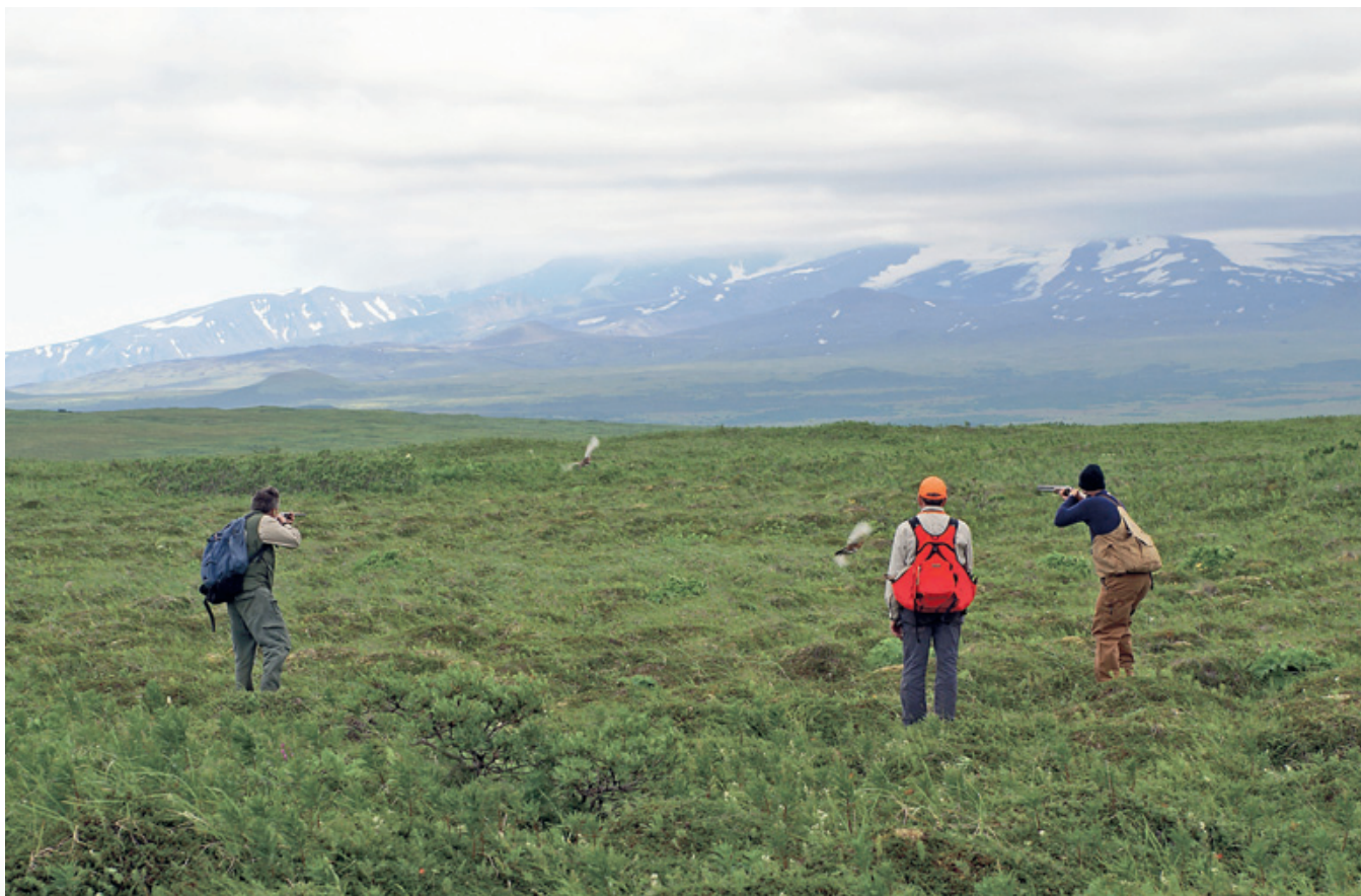
Даже при плохой погоде – почти что естественной для Аляски – охота по перу может быть превосходной и зрелищной

На счастье, в приюте был отделён небольшой уголок под лавку, забитую коробками с патронами и рыбацкими приманками. Мне потребовались патроны к концу второго дня, так