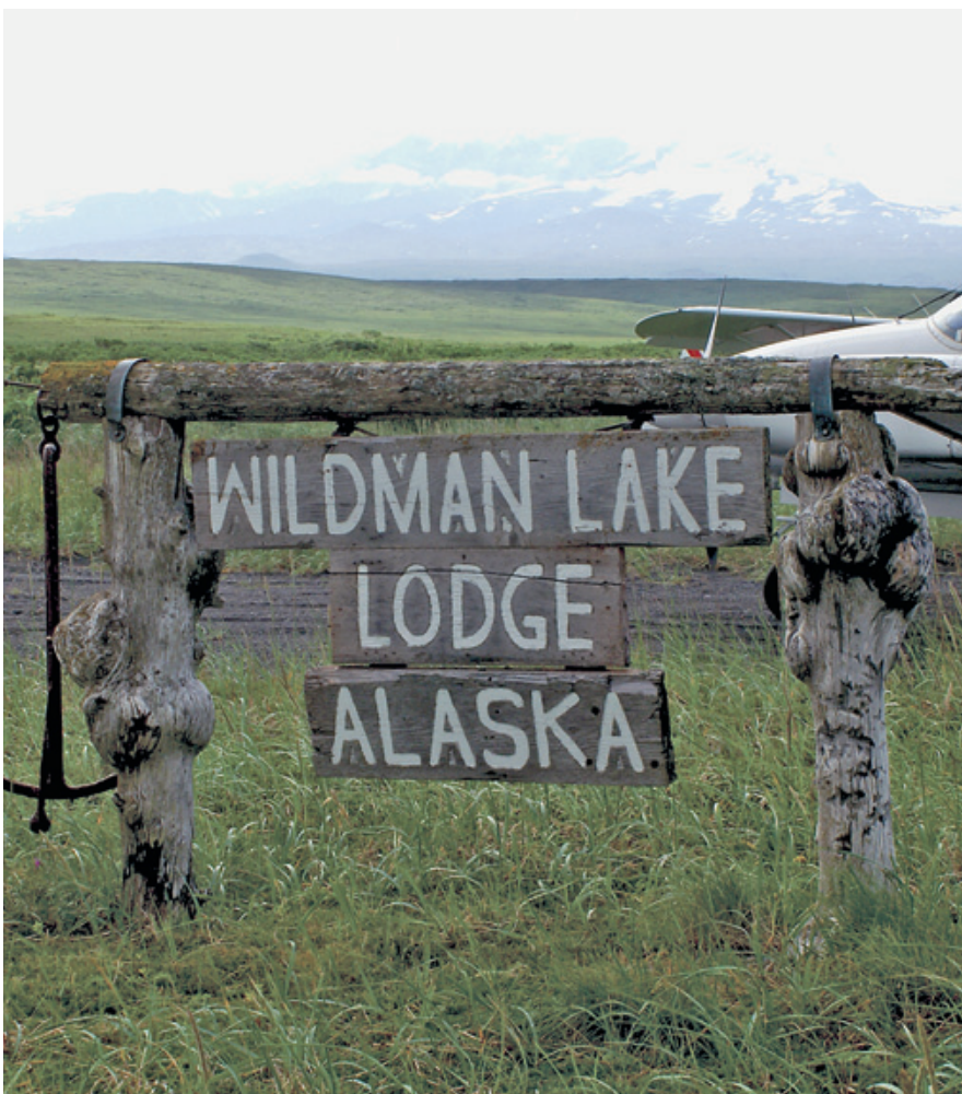
Приют «Уайлдмэн Лэйк Лодж», расположенный на полуострове Аляска, предлагает множество приключений